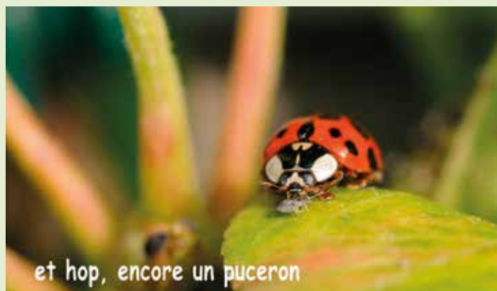
et hop, encore un puceron