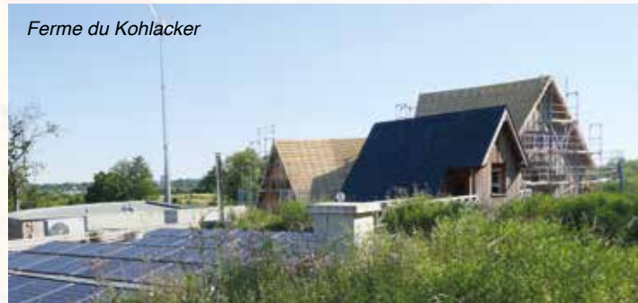
Ferme du Kohlacker

Ce bâtiment, complètement emmaillotté de 20 cm de fibre de bois, pourvu de baies en