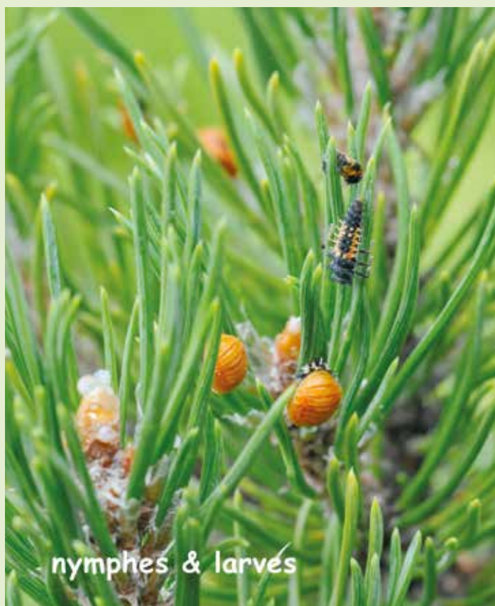
nymphes & larves

Texte : Béatrice Chomik