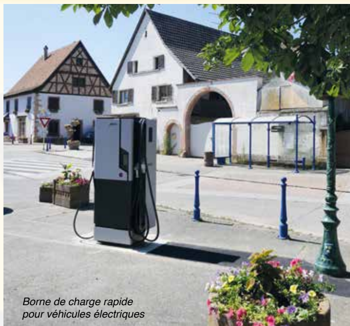
Borne de charge rapide pour véhicules électriques

En effet, ces deux bornes sont implantées l'une sur le parking de la place de la mairie « Dorfplatz » et l'autre à proximité de l'Espace Le Trèfle. Il conviendra d'acquérir un badge à la mairie pour pouvoir y accéder. Les 6 premiers mois, la charge sera gratuite, le temps de déterminer un tarif juste et adéquat, à partir des fréquences d'utilisation et de la consommation moyenne par véhicule.