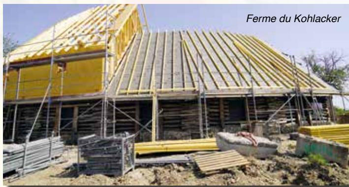
Ferme du Kohlacker

triple vitrage et d'une ventilation à double flux, présente toutes les caractéristiques d'une école basse consommation. L'installation sur la toiture de panneaux photovoltaïques 36 kw, tout en vendant de l'électricité, confèrera au bâtiment le statut d'une école positive, c'est-à-dire qu'elle produira plus d'électricité qu'elle n'en consommera.